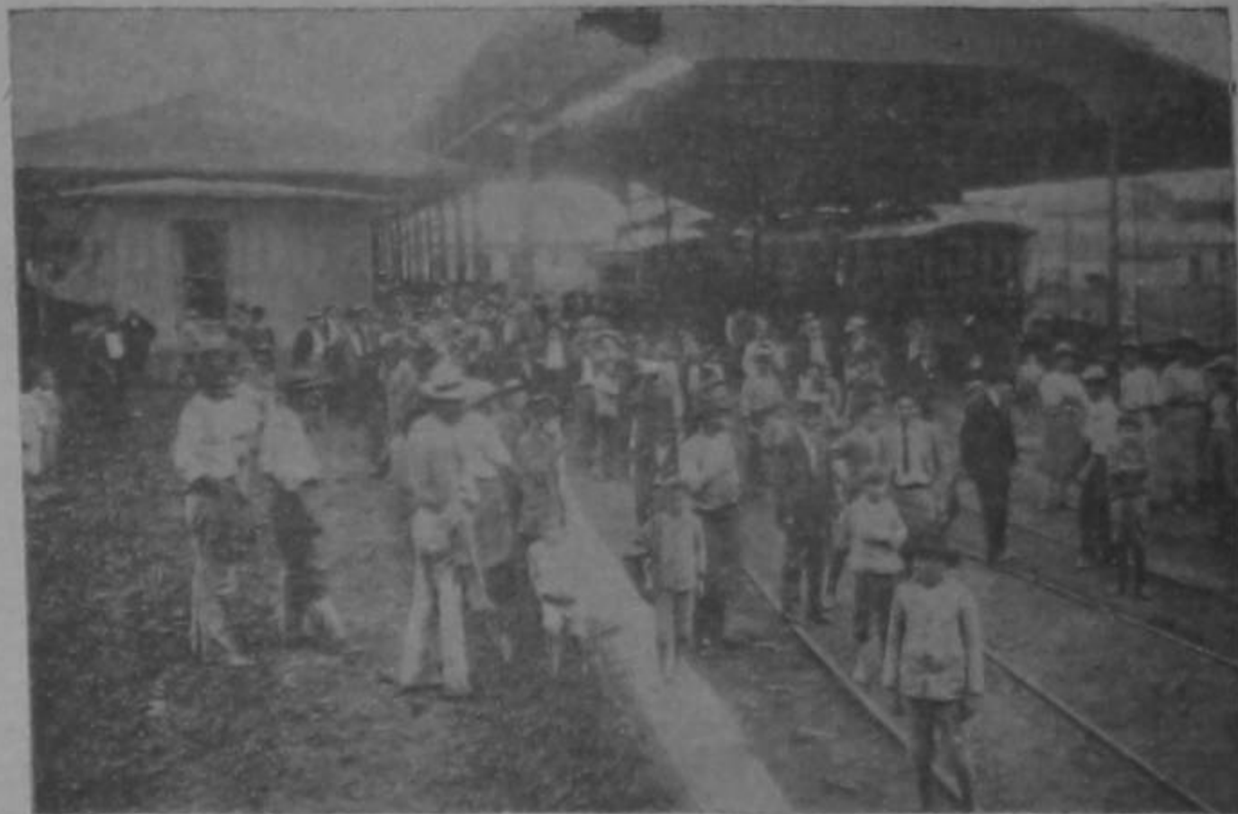
Los obreros esperando la llegada del tren